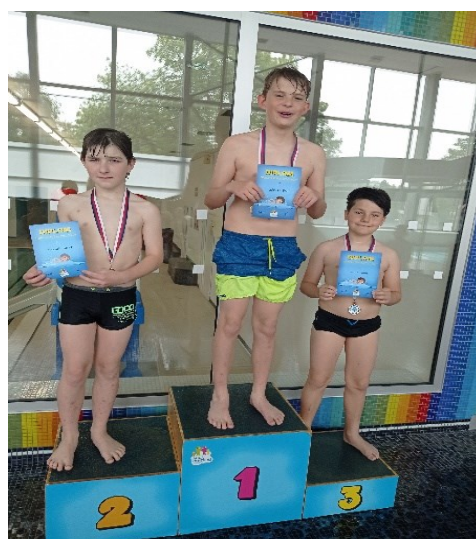
Nejrychlejší plavci 5. r.