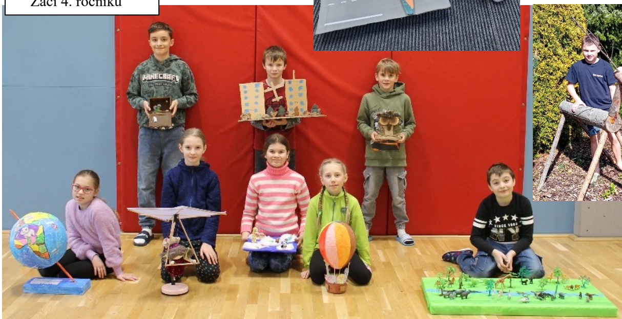
Žáci 4. ročníku