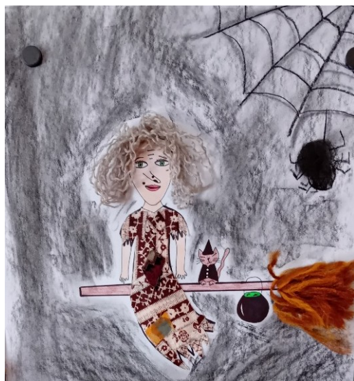
Nakreslila A. Jeřábková, 4. r.