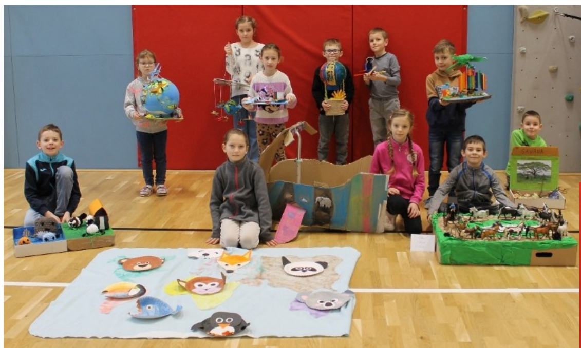
Žáci 2. ročníku se svými výrobky