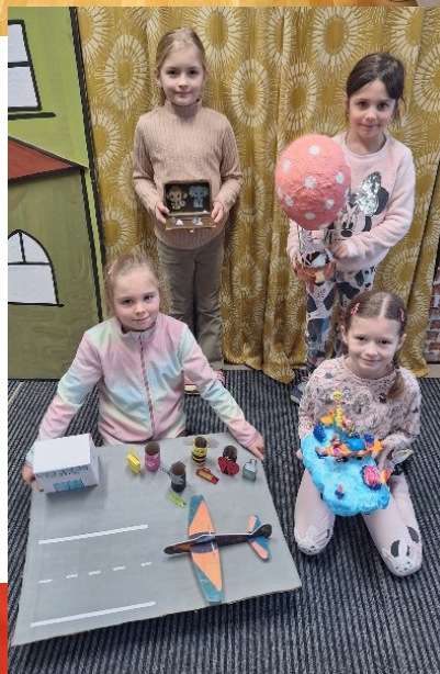
Žáci 1. ročníku

Tato odměna se dětem moc líbila, film zaujatě sledovaly a držely palce hlavním hrdinům. Také obě cesty linkovým autobusem proběhly v klidu a pohodě. Vstupenka i doprava byly hrazeny z prostředků SRD.