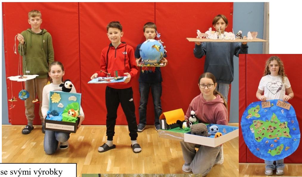
Žáci 5. ročníku se svými výrobky

Do projektu na téma „Letem světem se zvířetem“ se zapojilo celkem 32 žáků, kteří byli za účast odměněni návštěvou pardubického kina CineStar, kde zhlédli film Zootropolis: Město zvířat 2.